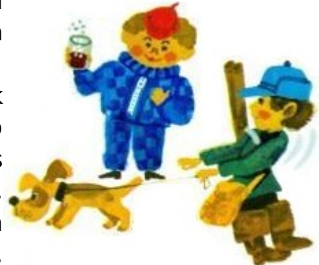
Sirupül e Glöbüil ko Bulül