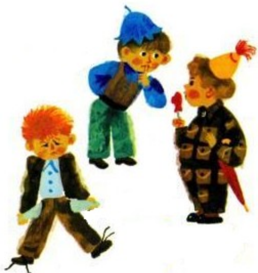
Perönülan, Seilan e Bastetül

Valikans äsmilons, bi äsevons, das Nenolikan äbinom luspikanu. Ab