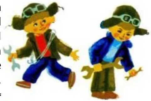
Skrübül e Lebuoniil

Elölogom, ab nos äkomon löpo koo. Te sol ästralon tulitiko love kap Nenolikana.