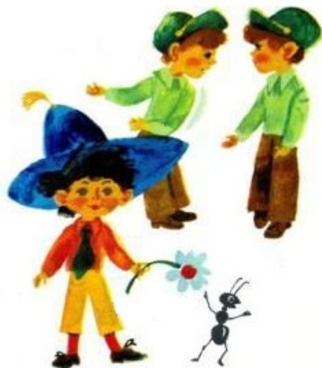
Nenolikan, Baiülan e Boülan