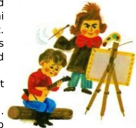
Kölamarüd e Lür