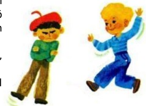
Murülan e Spidülan